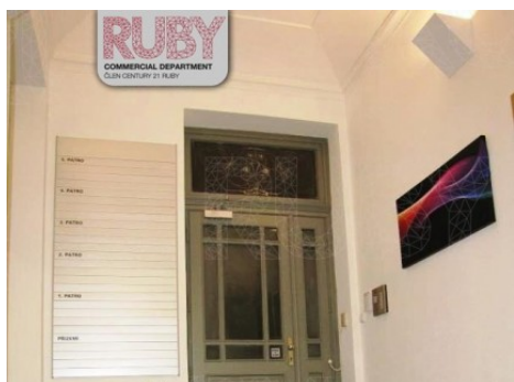
Praha 7 | Jablonského