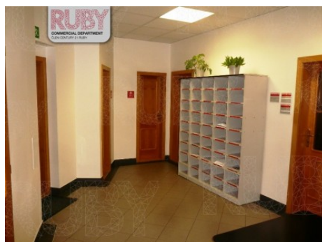
Praha 7 | Jablonského