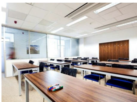
Ústí nad Labem město | Špitálské náměstí