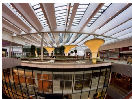
Ostrava | 28. října