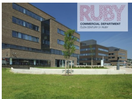
Brno střed | Holandská