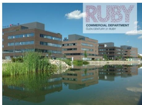
Brno střed | Holandská