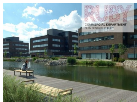
Brno střed | Holandská