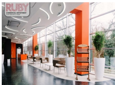
Praha 3 | Vinohradská