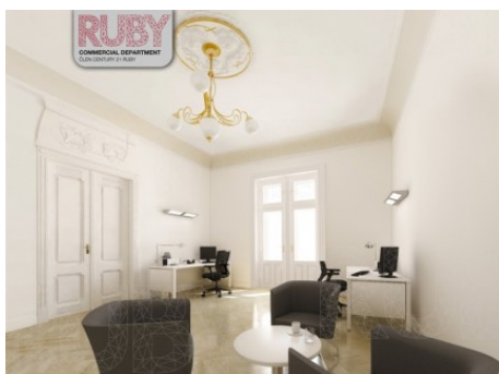
Praha 1 | 28. října