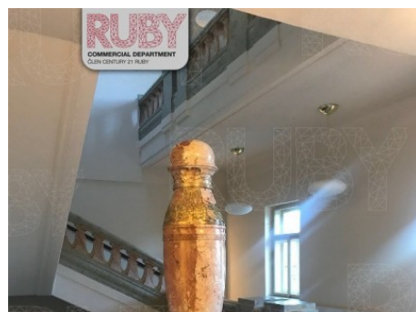
Praha 1 | 28. října