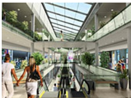
Praha 8 | Hnězdenská