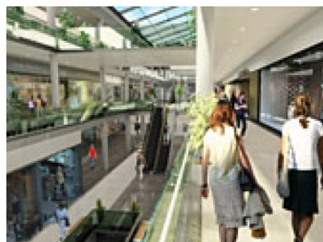
Praha 8 | Hnězdenská