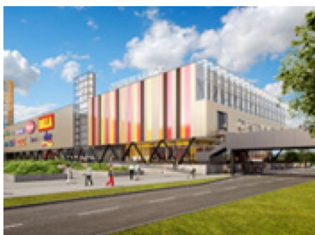
Praha 8 | Hnězdenská