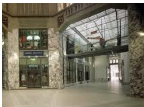
Praha 1 | Václavské náměstí