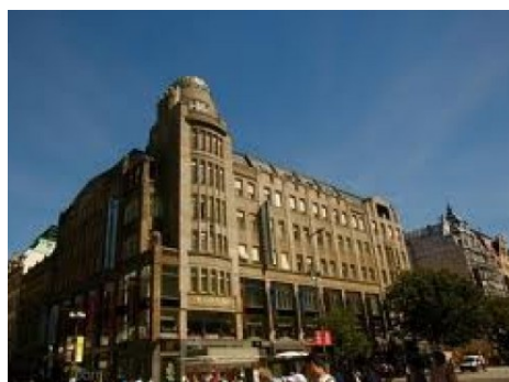
Praha 1 | Václavské náměstí