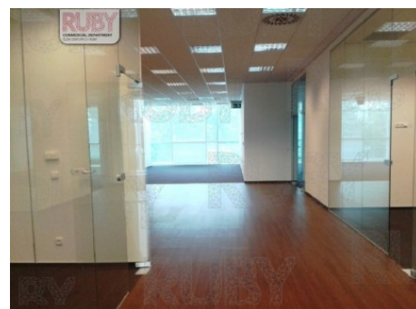
Praha 4 | Hvězdova