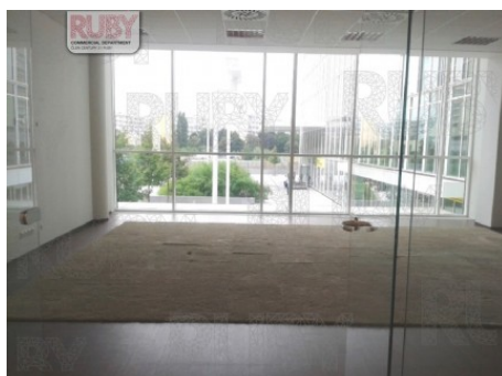
Praha 4 | Hvězdova