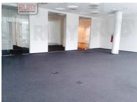
Praha 4 | Hvězdova