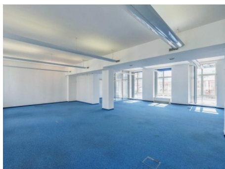
Praha 8 | Thámova