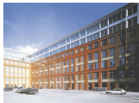
Praha 8 | Thámova