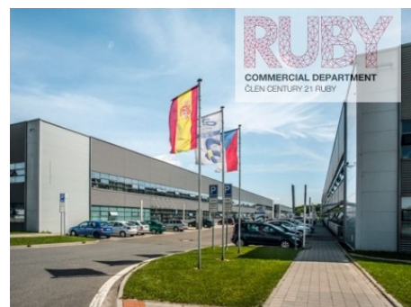
Ostrava | Na Rovince