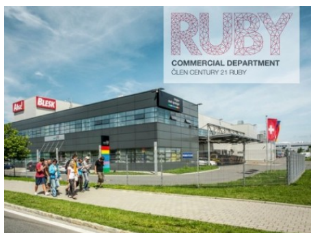
Ostrava | Na Rovince