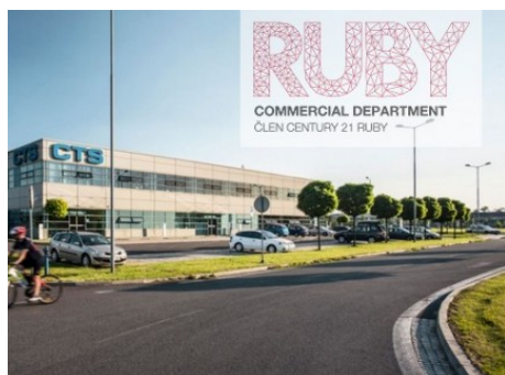
Ostrava | Na Rovince