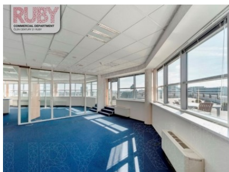
Praha 4 | Doudlebská