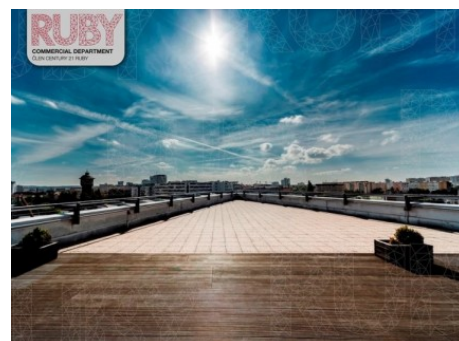
Praha 4 | Doudlebská