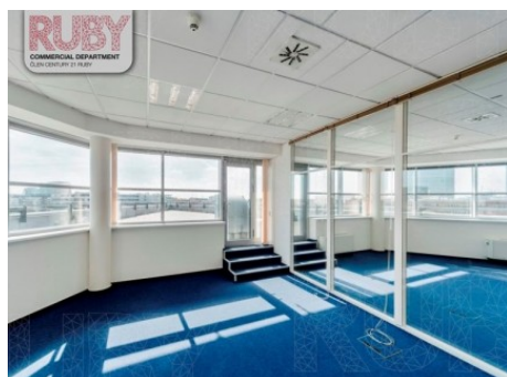
Praha 4 | Doudlebská