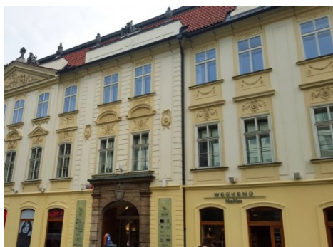
Praha 1 | Na Příkopě