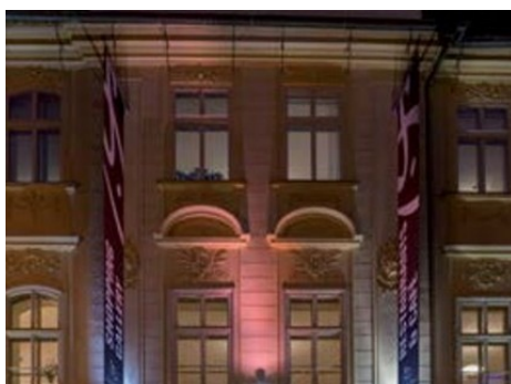
Praha 1 | Na Příkopě