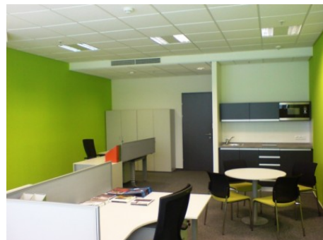
Praha 1 | Václavské náměstí