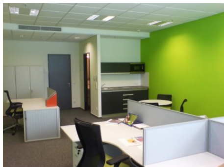
Praha 1 | Václavské náměstí