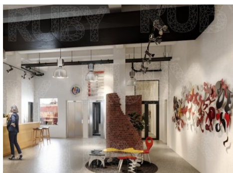
Praha 9 | Lihovarská