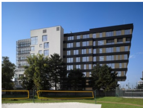
Praha 4 | Budějovická