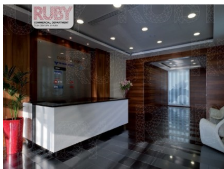
Praha 8 | Sokolovská