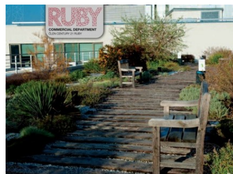
Praha 8 | Sokolovská