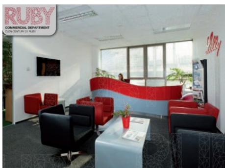
Praha 8 | Sokolovská