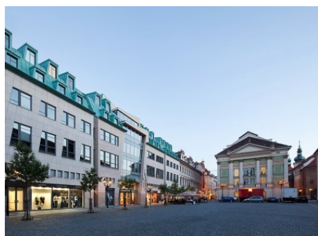
Praha 1 | Na Příkopě