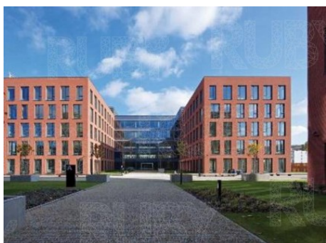
Praha 8 | Sokolovská