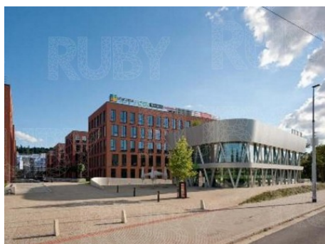
Praha 8 | Sokolovská