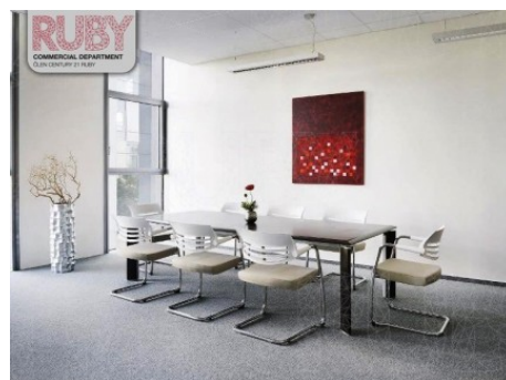
Praha 3 | Vinohradská