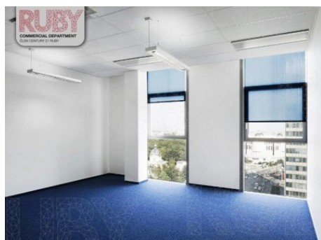
Praha 3 | Vinohradská