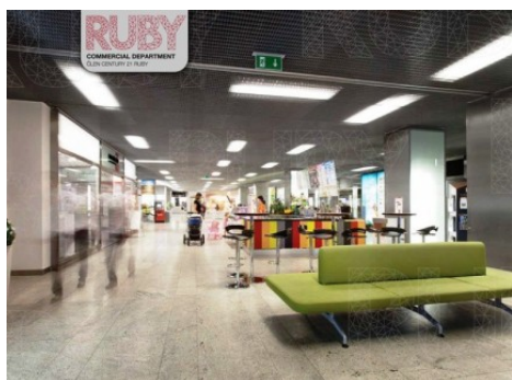
Praha 4 | Želetavská