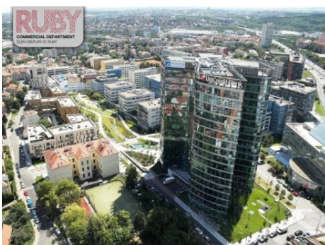
Praha 4 | Želetavská