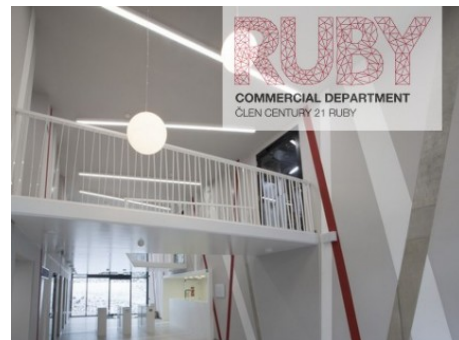
Praha 4 | Michelská