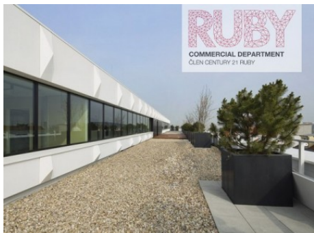
Praha 4 | Michelská