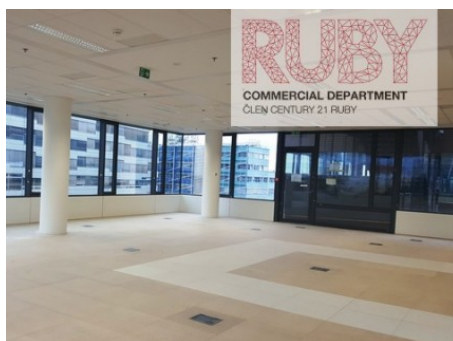
Praha 4 | Vyskočilova