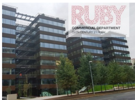
Praha 4 | Vyskočilova