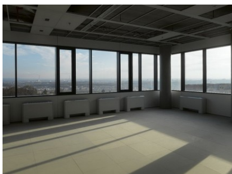
Praha 9 | Prosecká