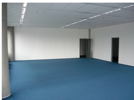
Praha 9 | Prosecká