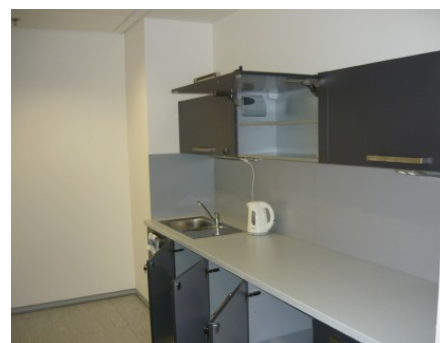
Praha 9 | Prosecká