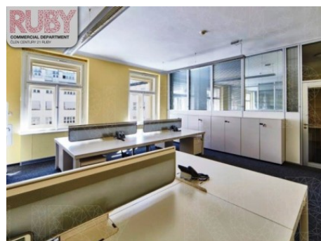
Praha 1 | Na Poříčí