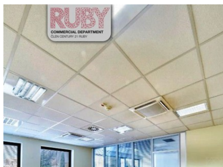
Praha 1 | Na Poříčí