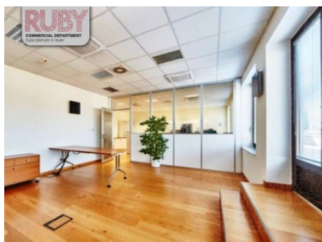
Praha 1 | Na Poříčí