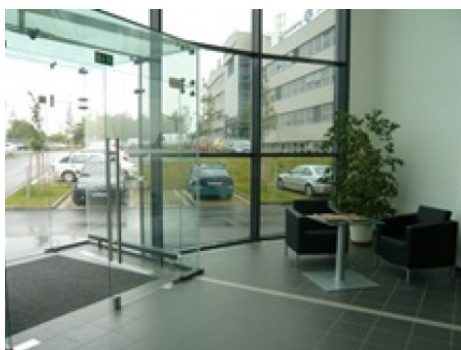
Praha 5 | K Hájům