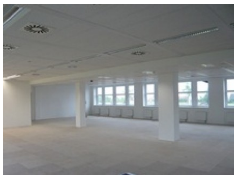
Praha 5 | K Hájům