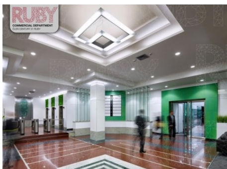
Praha 1 | Klimentská