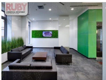
Praha 1 | Klimentská