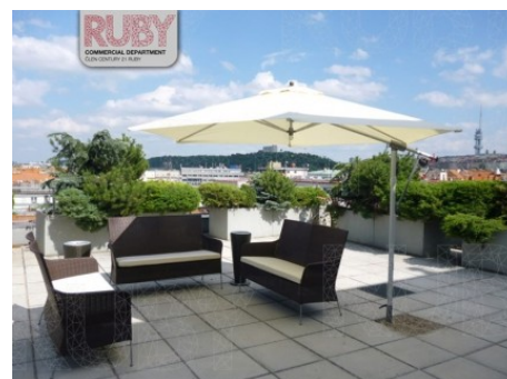
Praha 1 | Klimentská