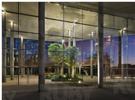
Praha 8 | Karolinská