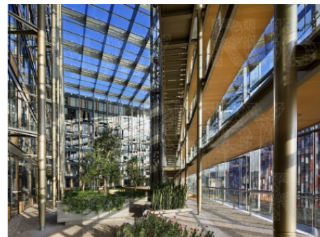
Praha 8 | Karolinská