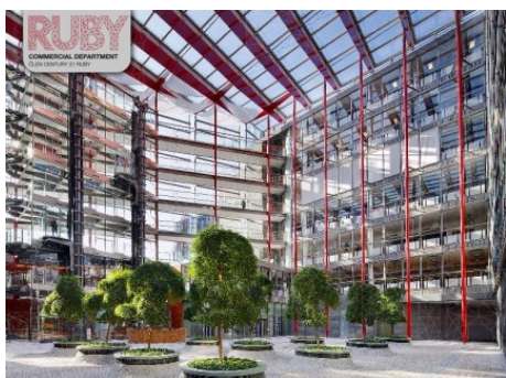
Praha 8 | Karolinská