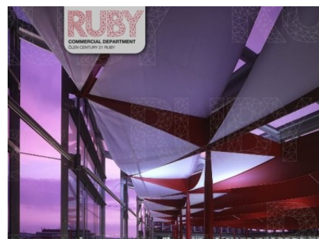
Praha 8 | Karolinská