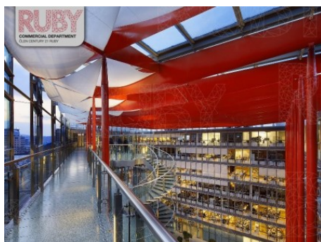
Praha 8 | Karolinská