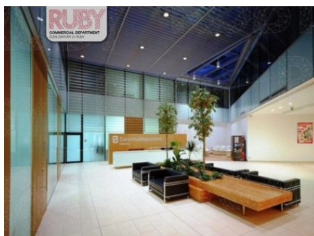
Praha 4 | Lomnického