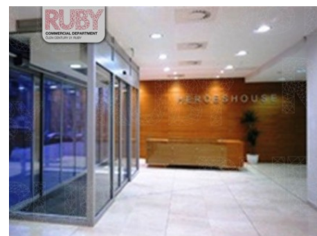
Praha 4 | Lomnického