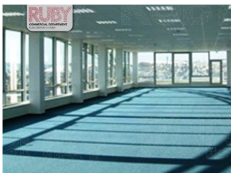
Praha 4 | Lomnického