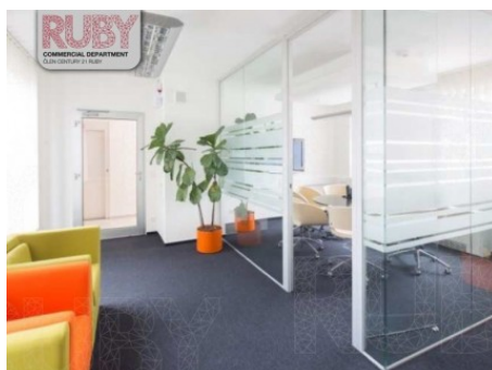
Praha 5 | Štefánikova