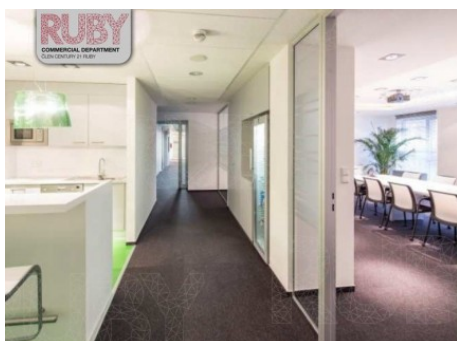
Praha 5 | Štefánikova