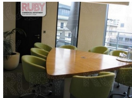
Praha 7 | Jankovcova