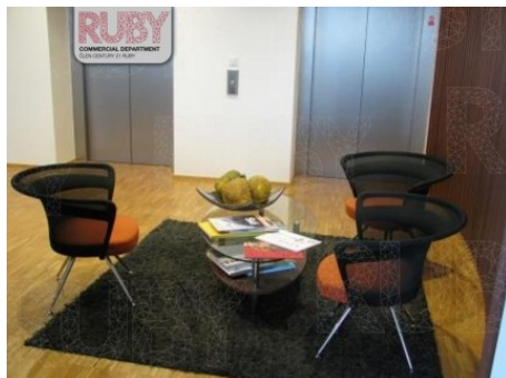
Praha 7 | Jankovcova