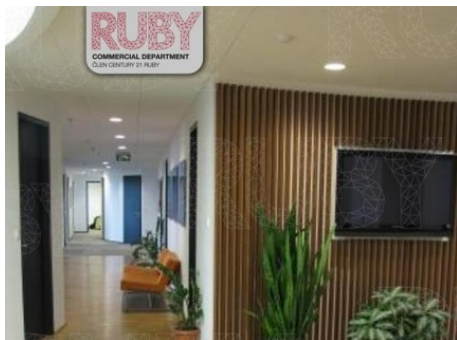
Praha 7 | Jankovcova