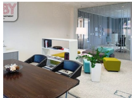
Praha 1 | Na Příkopě