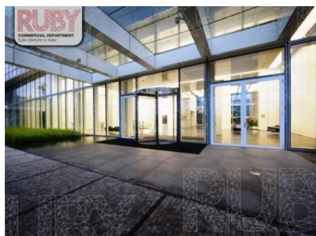
Praha 4 | Hvězdova