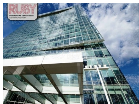
Praha 4 | Hvězdova