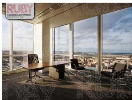
Praha 4 | Hvězdova