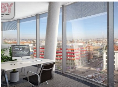
Praha 5 | Plzeňská