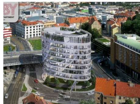
Praha 5 | Plzeňská