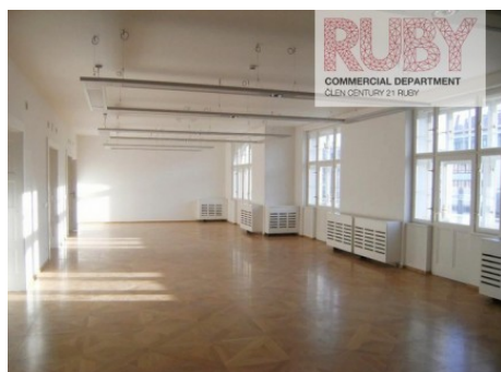
Praha 1 | Václavské náměstí