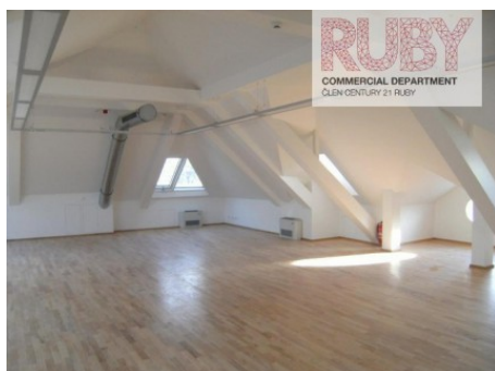
Praha 1 | Václavské náměstí