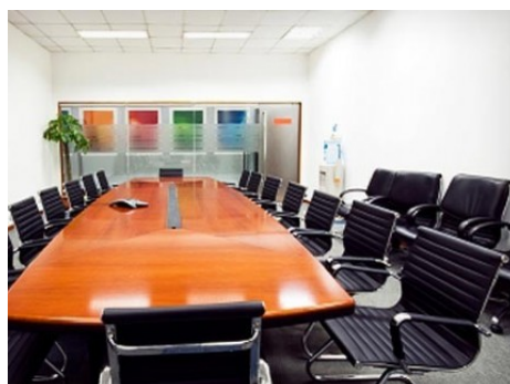
Praha 4 | Na Pankráci