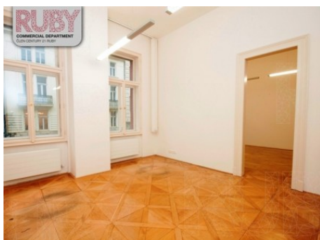
Praha 1 | Vodičkova