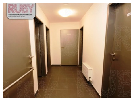
Praha 1 | Vodičkova