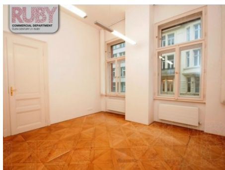
Praha 1 | Vodičkova