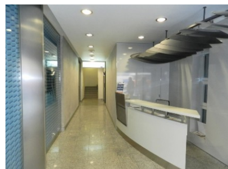
Praha 1 | Na Poříčí