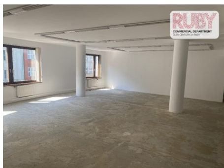
Praha 1 | Na Poříčí