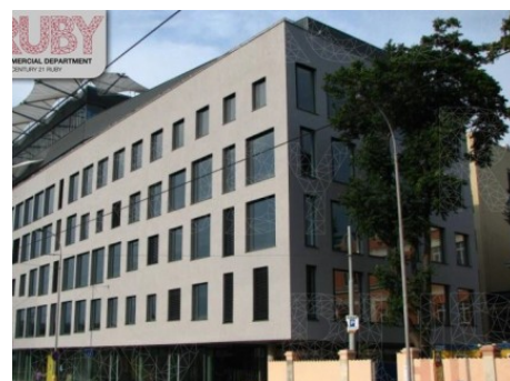
Praha 5 | Nádražní