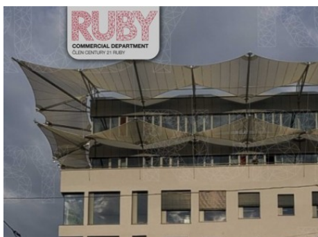
Praha 5 | Nádražní