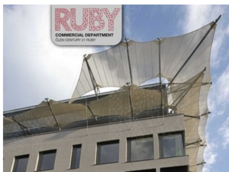
Praha 5 | Nádražní