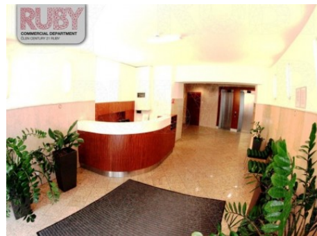
Praha 1 | Truhlářská