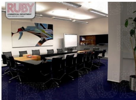
Praha 1 | Truhlářská