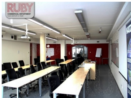
Praha 1 | Truhlářská