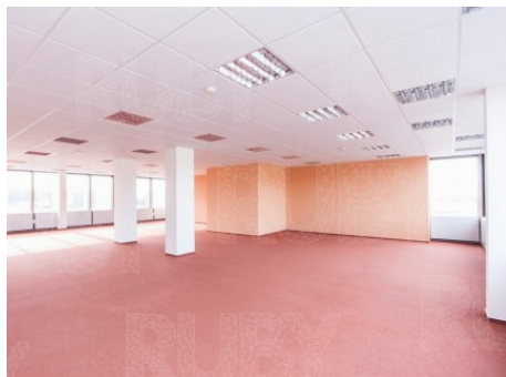
Praha 10 | Kodaňská