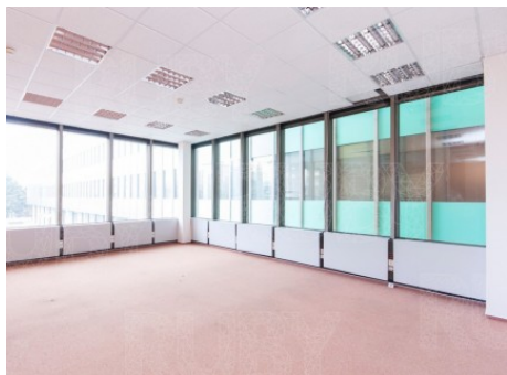
Praha 10 | Kodaňská