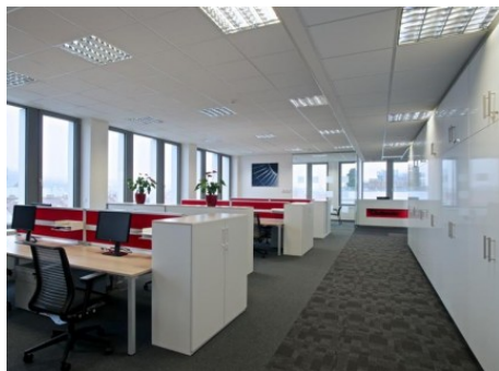
Praha 8 | Rohanské nábřeží