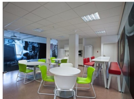
Praha 8 | Rohanské nábřeží