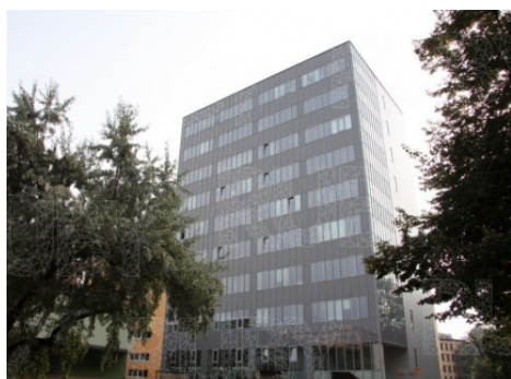
Praha 7 | Jankovcova