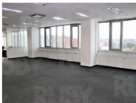
Praha 7 | Jankovcova