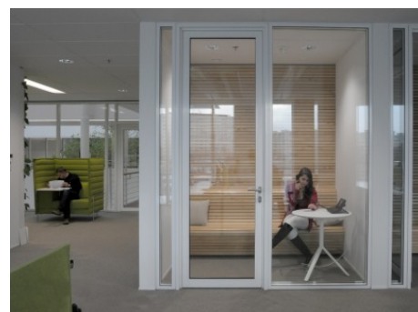
Praha 4 | Hvězdova