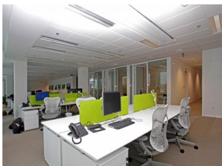
Praha 4 | Hvězdova