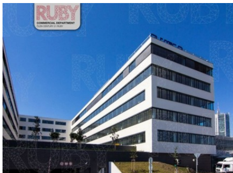
Praha 4 | Budějovická