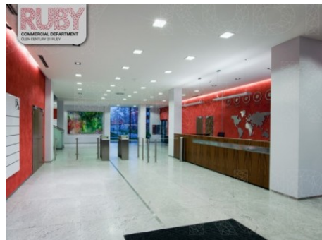
Praha 4 | Budějovická