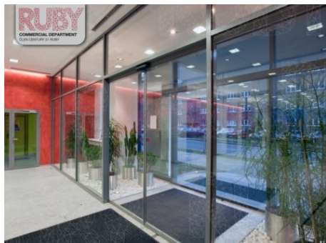
Praha 4 | Budějovická