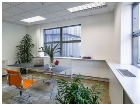
Praha 1 | Rybná