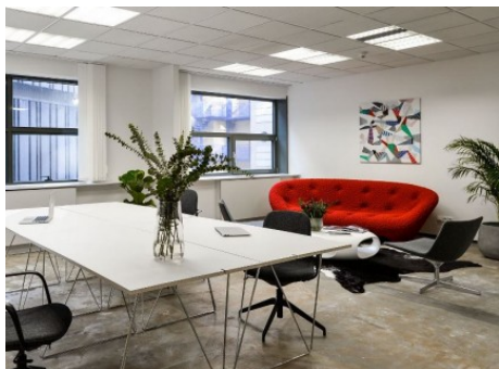
Praha 1 | Rybná