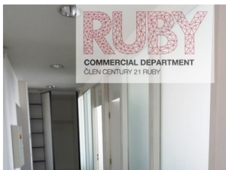
Praha 1 | Revoluční