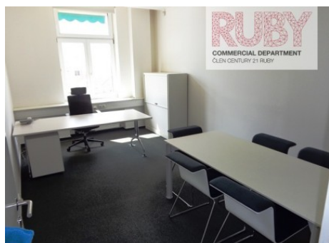
Praha 1 | Revoluční