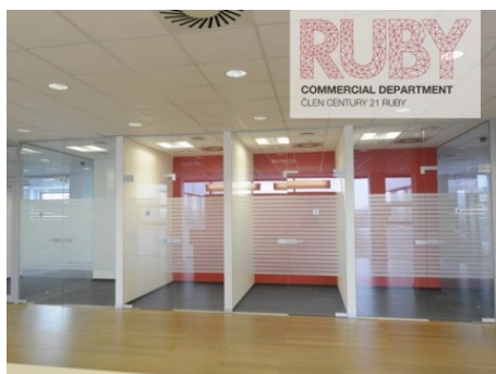
Ostrava | Hornopolní