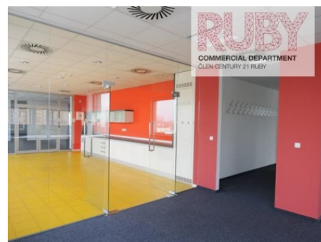
Ostrava | Hornopolní