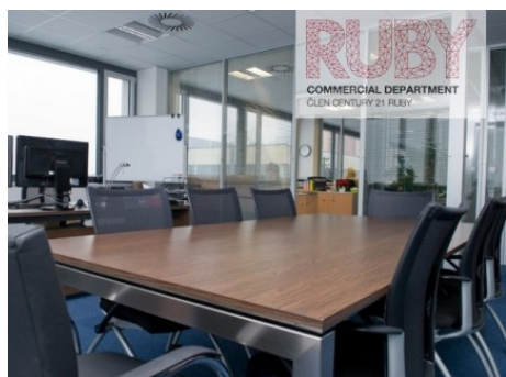
Ostrava | Hornopolní