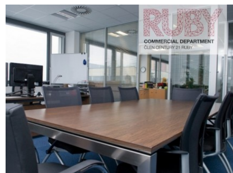
Ostrava | Hornopolní