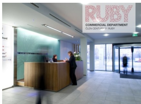
Ostrava | Hornopolní