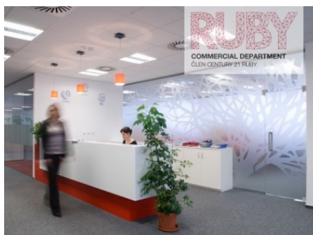
Ostrava | Hornopolní